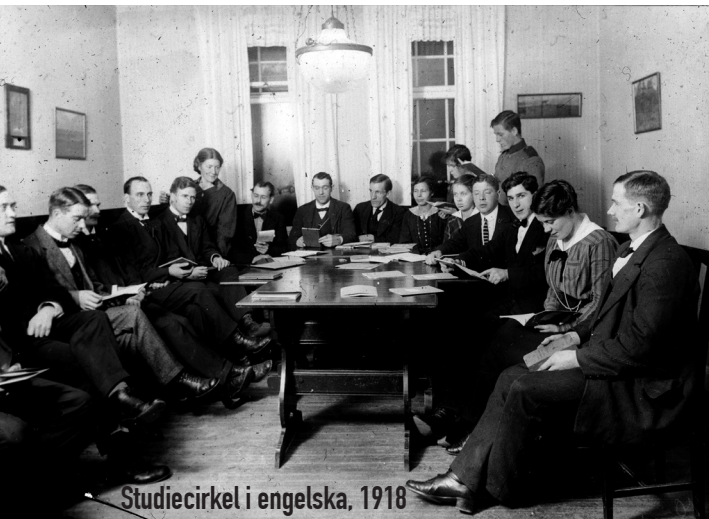
Studiecirkel i engelska, 1918