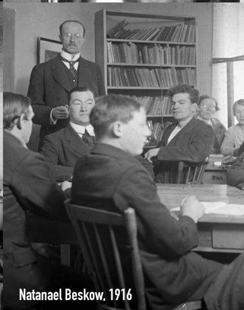
Natanael Beskow, 1916