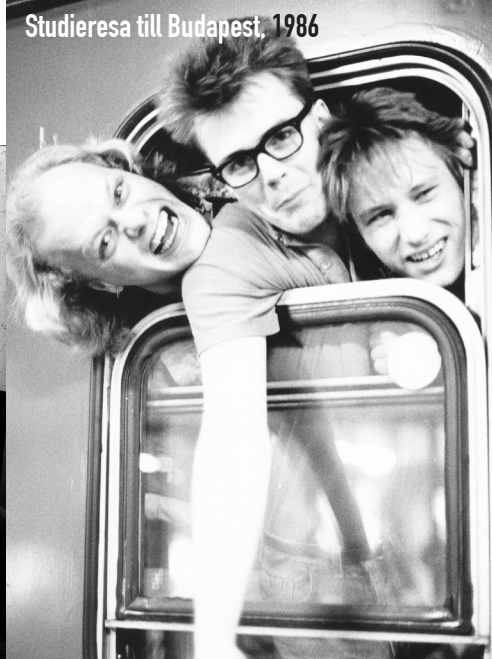
Studieresa till Budapest, 1986